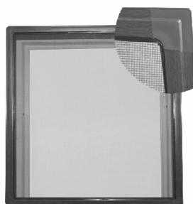
Moskitiera ramkowa - system kołnierzowy dostępny w kolorach: biały, brąz, antracyt, złoty dąb, orzech, mahoń