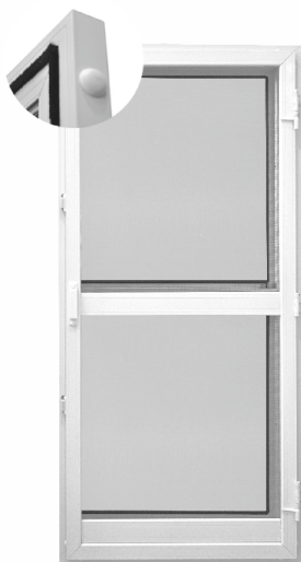
Moskitiera drzwiowa otwierana dostępna w kolorach: biały i brąz